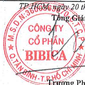
Trương Phú Chiên